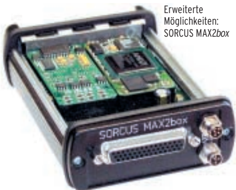
Erweiterte Möglichkeiten: SORCUS MAX2box

Über entsprechende Adapter sind auch Schraubklemmen oder andere Stecker möglich. Die MAX2box enthält zusätzlich einen Slot für eine CF-Card, z. B. für austauschbaren Speicher als Flash-Card oder Micro-Drive oder auch für eine WLAN-Karte. Alle MAX-Module sind in beiden Boxen einsetzbar. Die Versorgung erfolgt wie bei der CANbox über eine Spannung von 6...60V DC, z. B. aus einem Steckernetzteil.