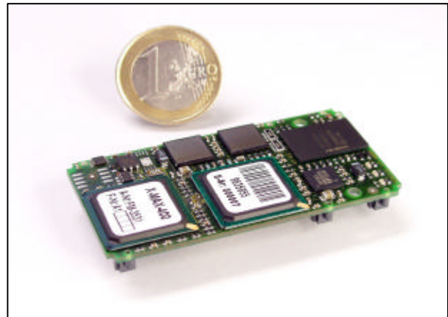
Abb. 1: X-MAX-400

Druckfehler, Irrtümer und Technischen Änderungen vorbehalten.